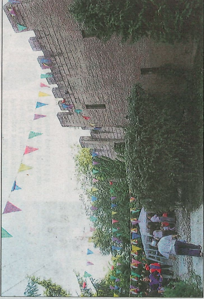
Le château du Lutzelbruch à l'époque où il y régnait une grande activité festive.

Pour sa Journée du patrimoine, la commune a fait appel aux Clandestines, un groupe de huit comédiennes qui ont appris à chanter ensemble et aiment par-dessus tout apporter une touche poétique et décalée dans l'espace public. Le parcours chanté qu'elles ont imaginé racontera les «histoires singulières» de deux maisons du village, le tout ponctué de chants italiens décrivant travaux et vie quotidienne d'une ruralité autretrois cousine de la nôtre. Dans la rue Charles-de-Wendel, les Clandestines évoqueront un grand incendie qui sévit au XIX e siècle, avant de conclure leur parcours en musique, dans la cour de la